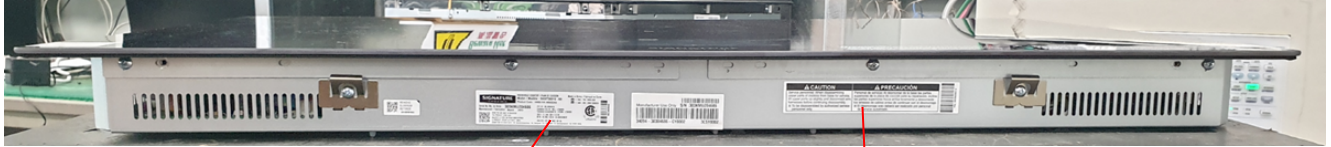
< Front side >